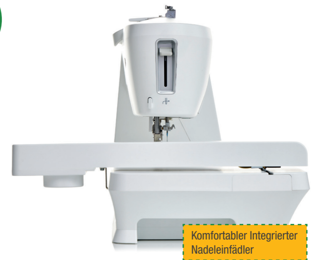
Komfortabler Integrierter Nadeleinfädler